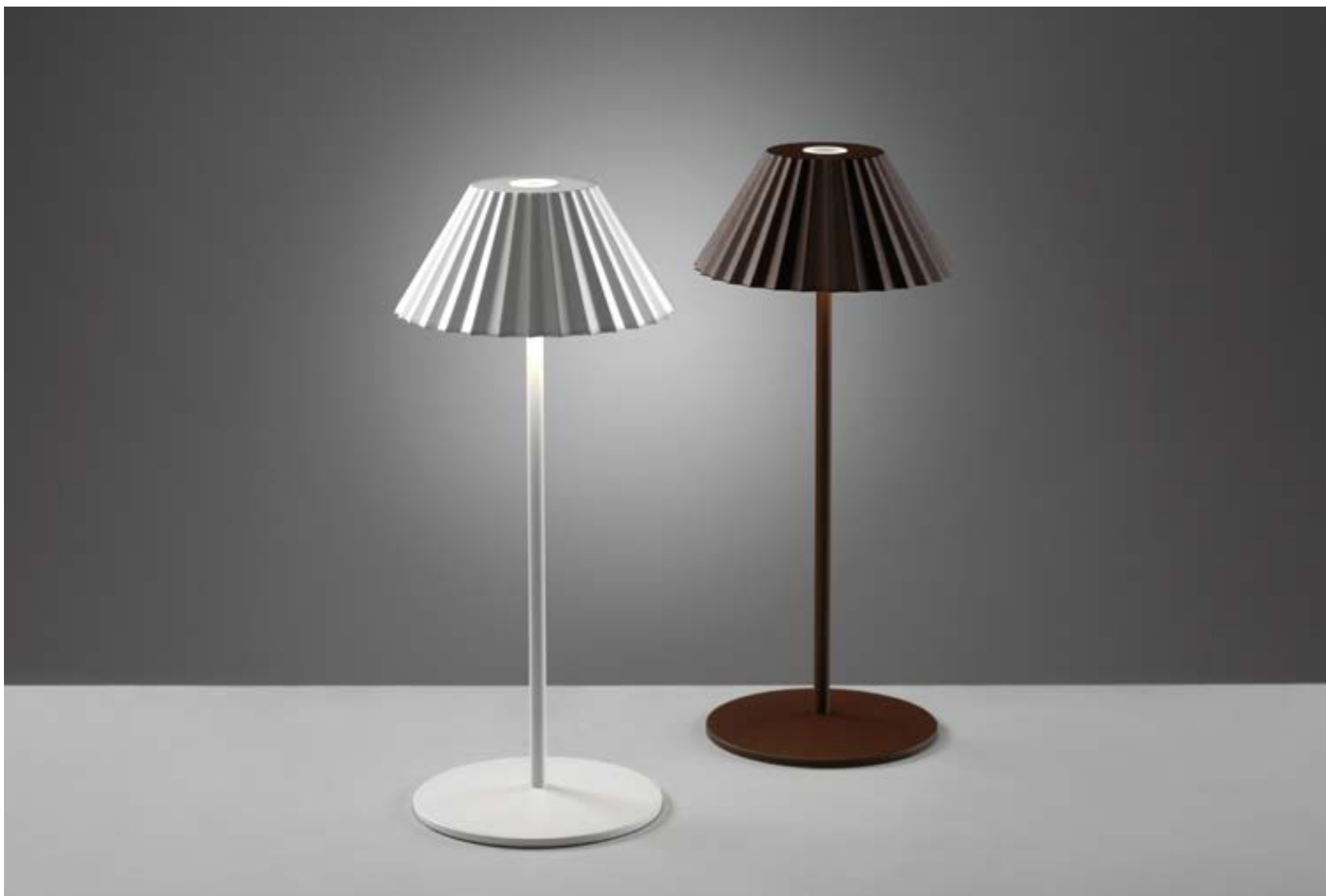
WAFFLE(Q) - WAFFLE(W)