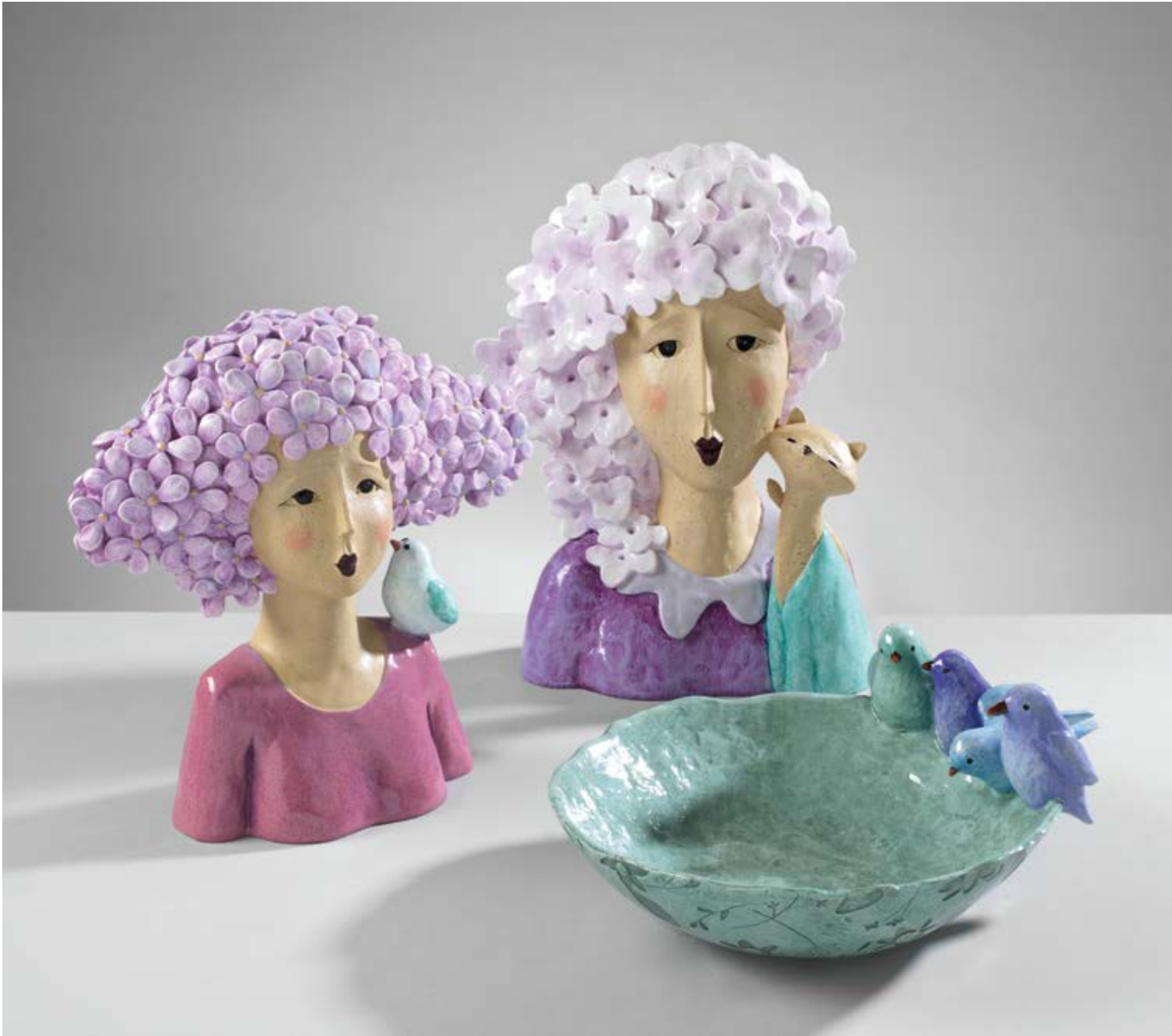
O1994 - O1993 - O1992