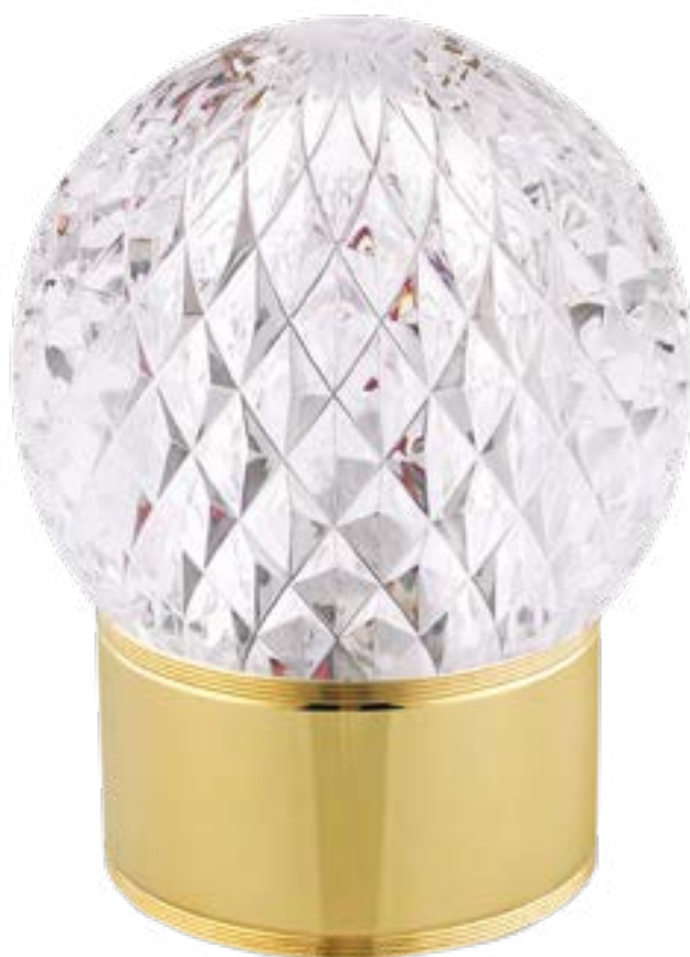
LEXA(B) LIGHT OFF