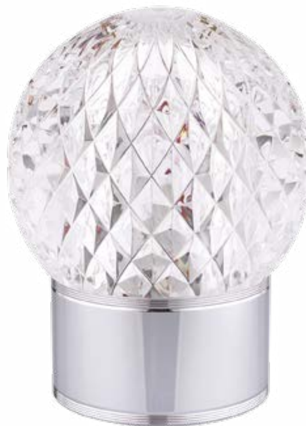
LEXA(A) LIGHT OFF