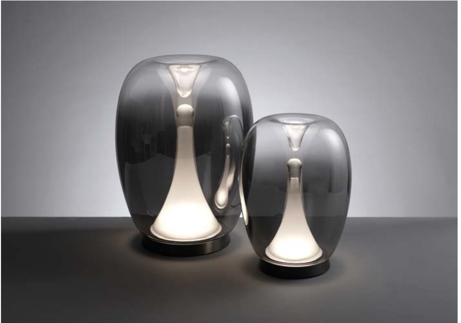
O2006 - O2005

O2006 - Lampada led da tavolo in vetro fumé con base in metallo e interruttore touch per la regolazione dell'intensità della luce Led smoky glass table lamp with metal base and touch dimming switch for light intensity adjustment - Diam. 27x36 h. cm. - 15 W / 3000K