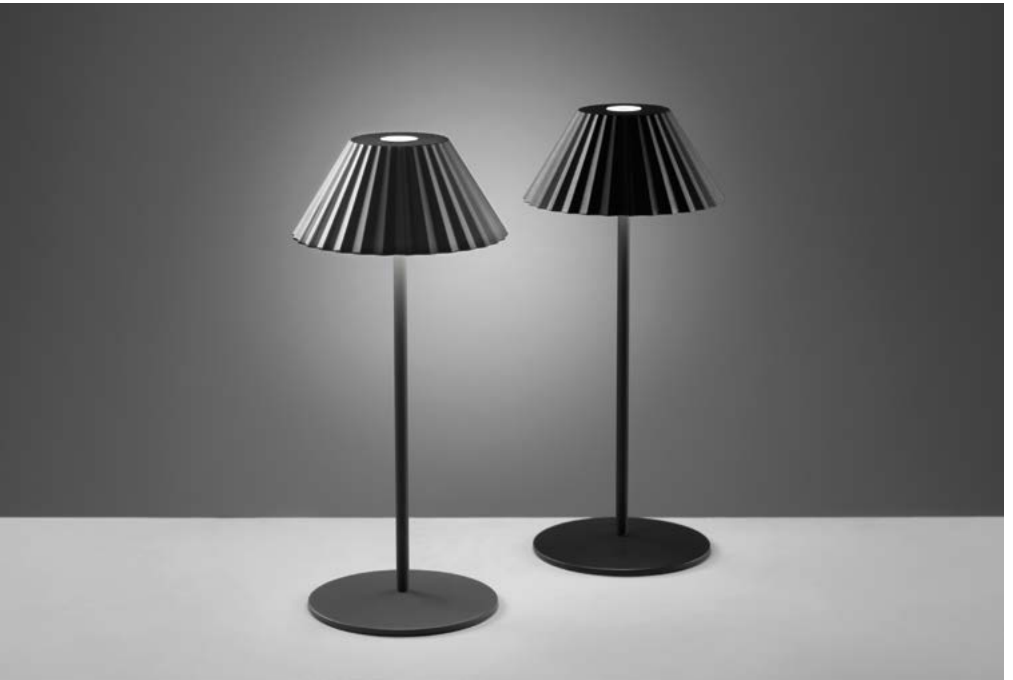
WAFFLE(D) - WAFFLE(T)