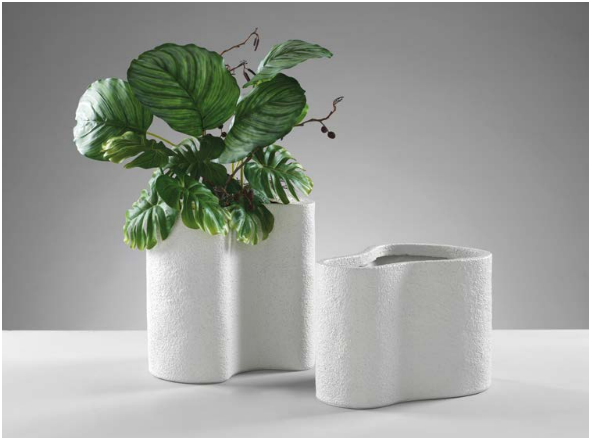
O1990 - O1989