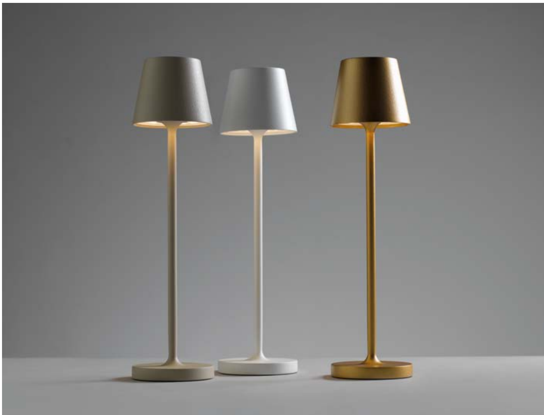
MICRO(Y) - MICRO(Q) - MICRO(B)