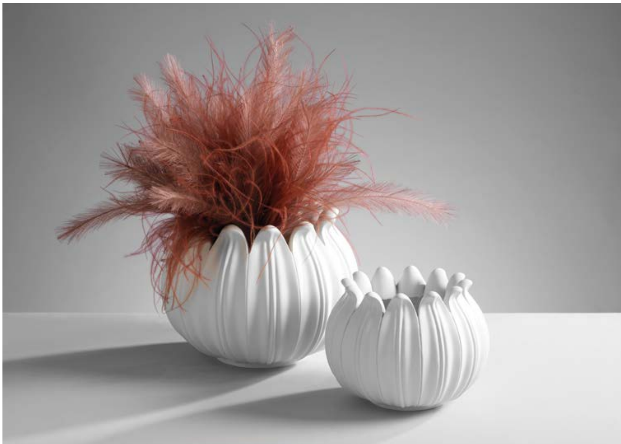
O1968 - O1967

O1968 - Vaso in resina / Resin vase Diam. 28,5x22 h. cm.