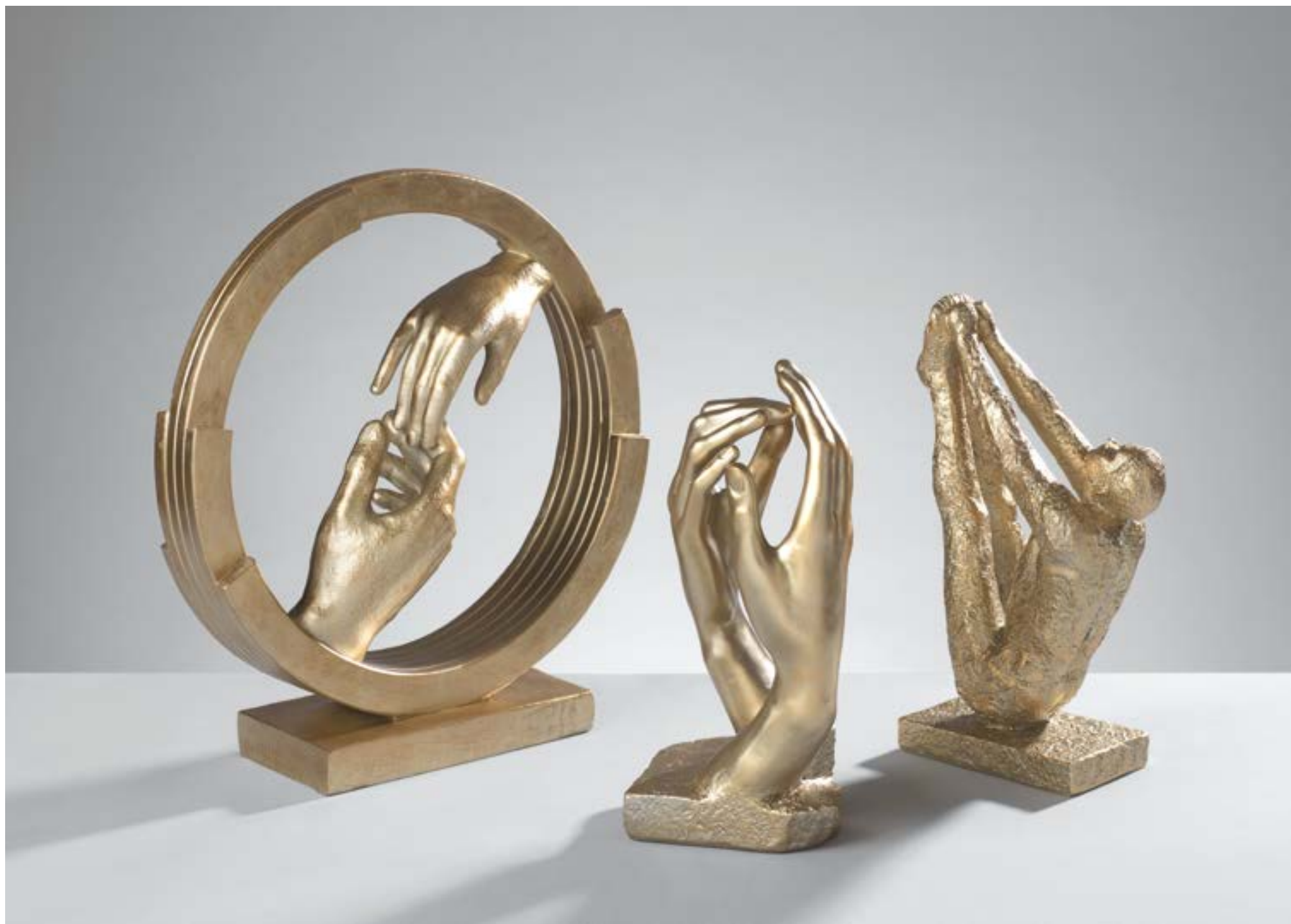
O1984 - O1983 - O1985

O1985 - Figura yoga in resina Yoga resin figure 17,5x10x29,5 h. cm.