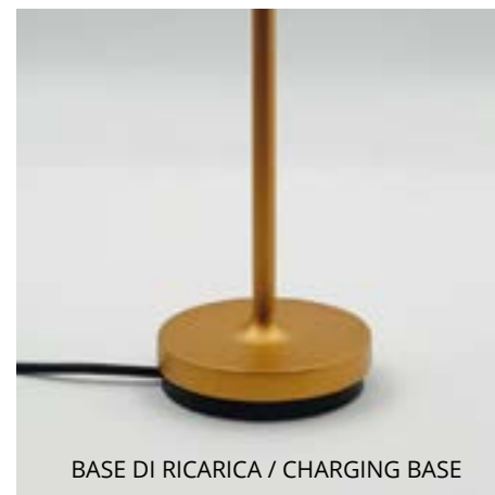
BASE DI RICARICA / CHARGING BASE

Oro / Gold (B) - Bianco / White (Q) - Sabbia / Sand (Y) - Diam. 7x27,5 h. cm.