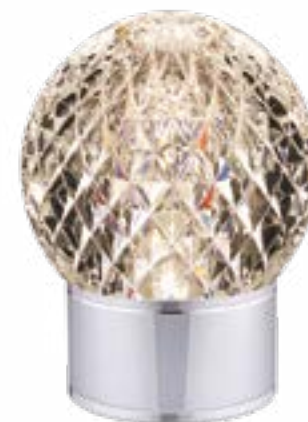
LEXA(A) LIGHT ON