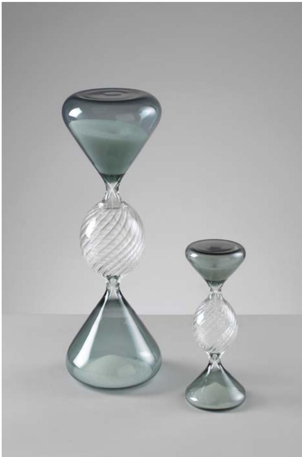
O1978 - O1977

O1980 - Clessidra tripla 15 min. con vetro bicolore 15 minutes triple sandtimer with two-tone glass H. 27 cm.