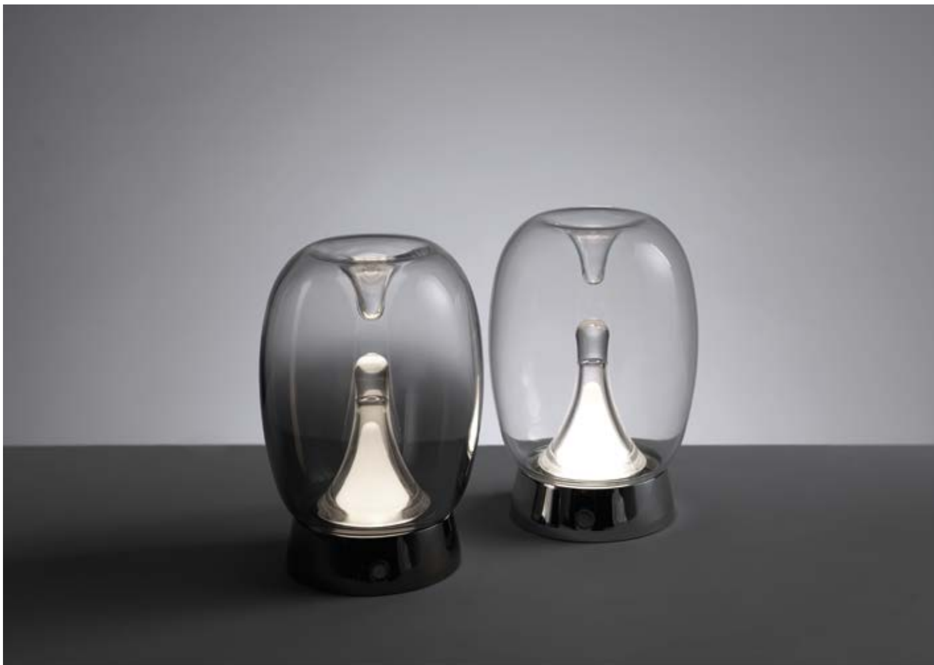
O2004(D) - O2004(X)