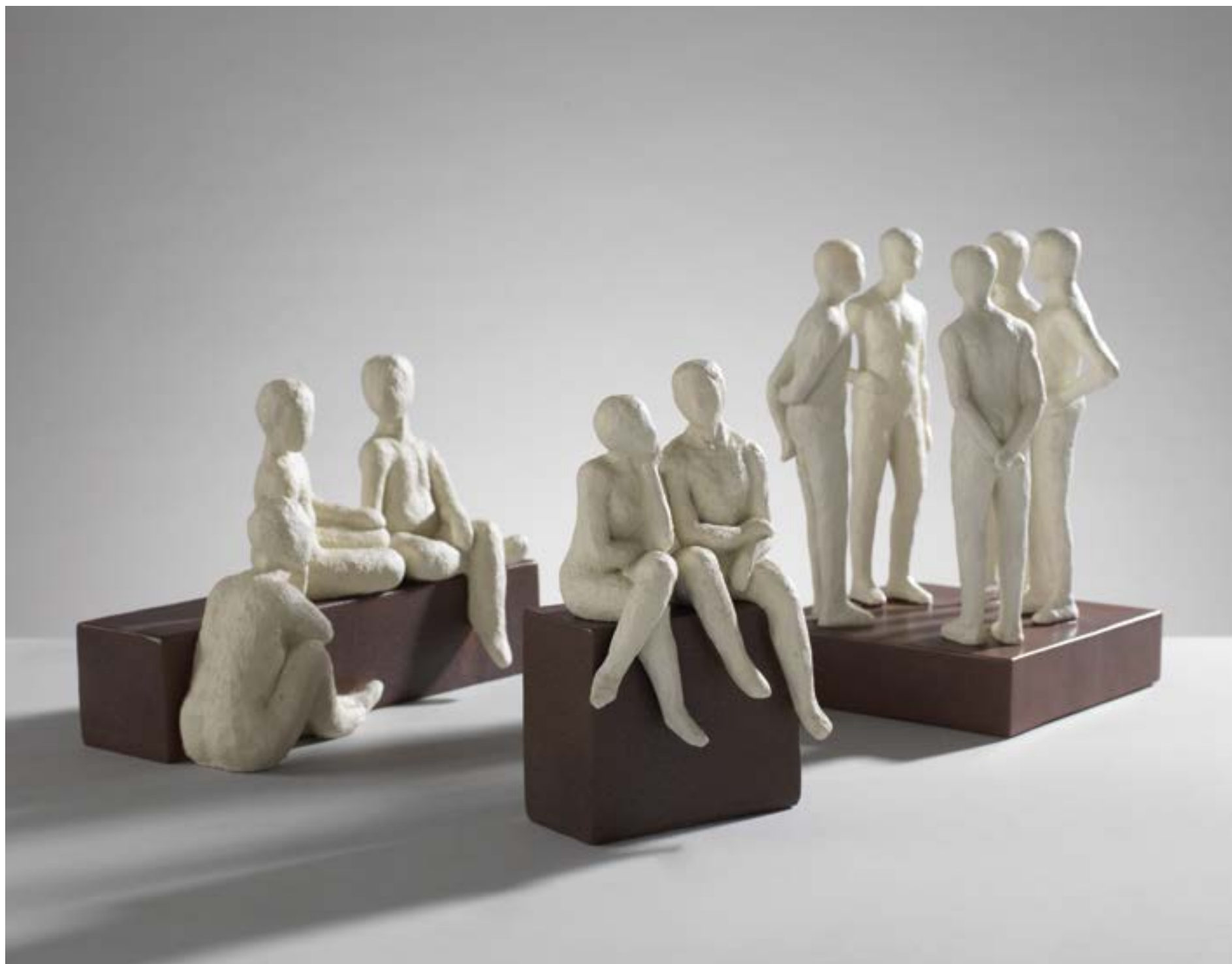
PEOPLE3 - PEOPLE2 - PEOPLE5

PEOPLE-5 - Figure in resina Resin figures - 19,5x17,5x27 h. cm.