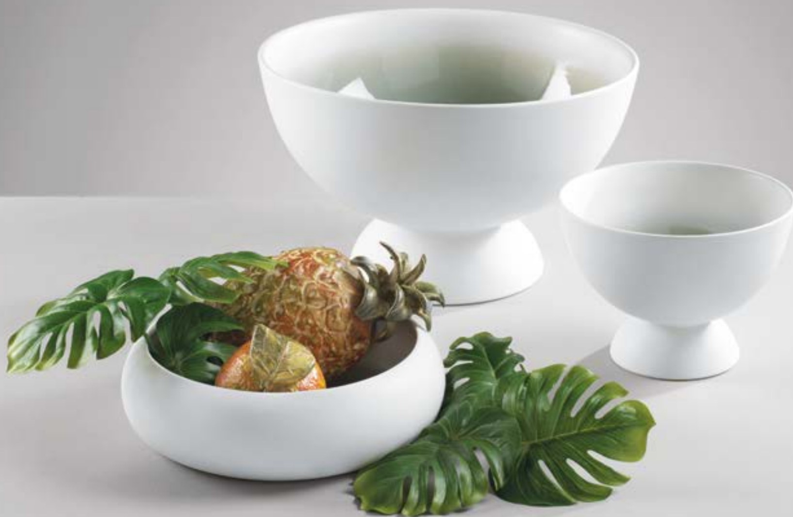
O1928 - O1927 - O1926

O1928 - Ciotola in ceramica con interno col. salvia lucido ed esterno bianco opaco Ceramic bowl shiny sage col. inside and matt white outside - Diam. 23,5x6,5 h. cm.