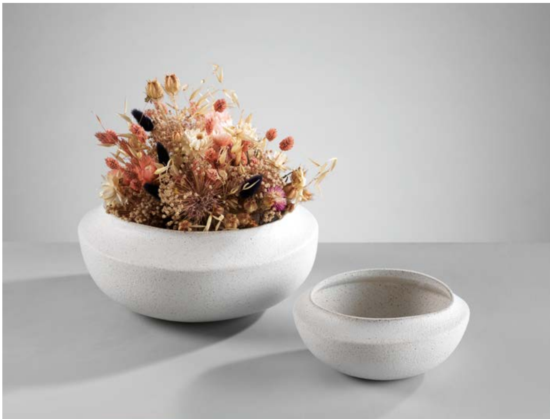
O1925 - O1924

O1925 - Ciotola in ceramica / Ceramic bowl - Diam. 31,5x14 h. cm.