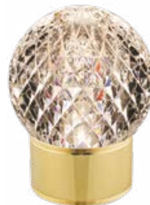
LEXA(B) LIGHT ON

Argento / Silver (A) - Oro / Gold (B) - Diam. 12x15,5 h. cm.